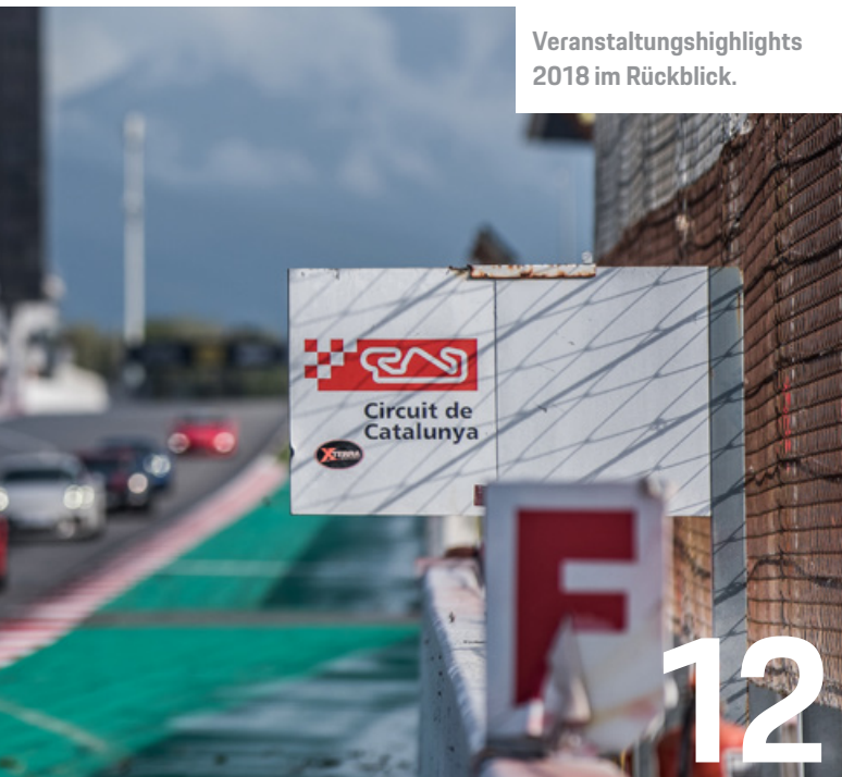
Veranstaltungshighlights 2018 im Rückblick.