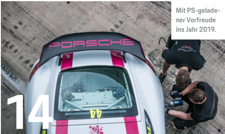
Mit PS-geladener Vorfreude ins Jahr 2019.