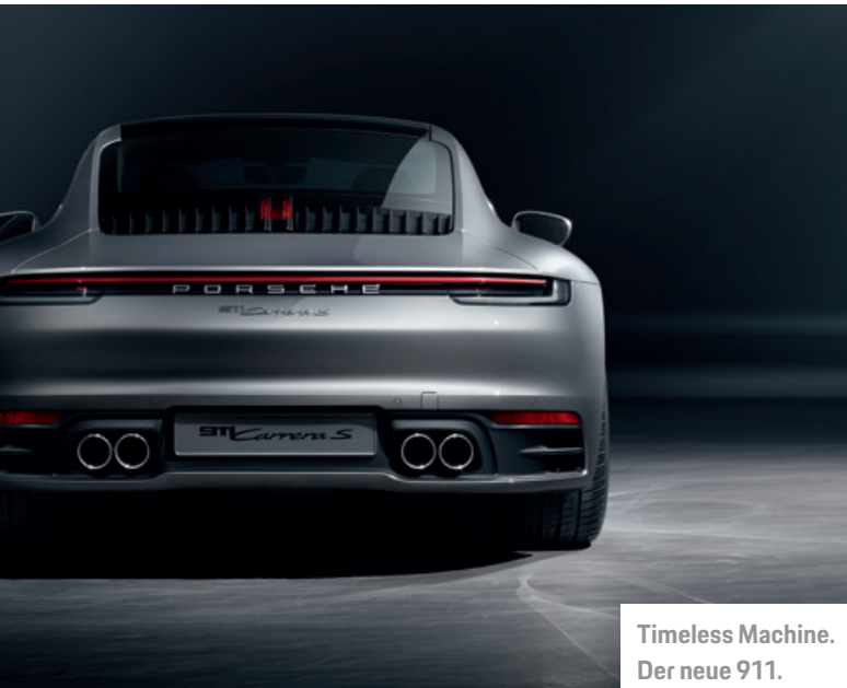
Timeless Machine. Der neue 911.