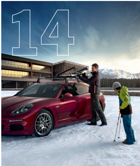
Bestens gerüstet. Mit Zubehör von Porsche Tequipment.