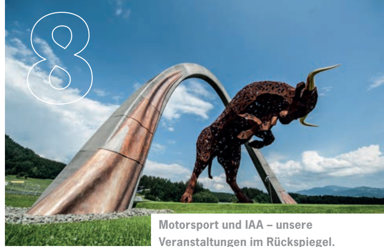
Motorsport und IAA – unsere Veranstaltungen im Rückspiegel.