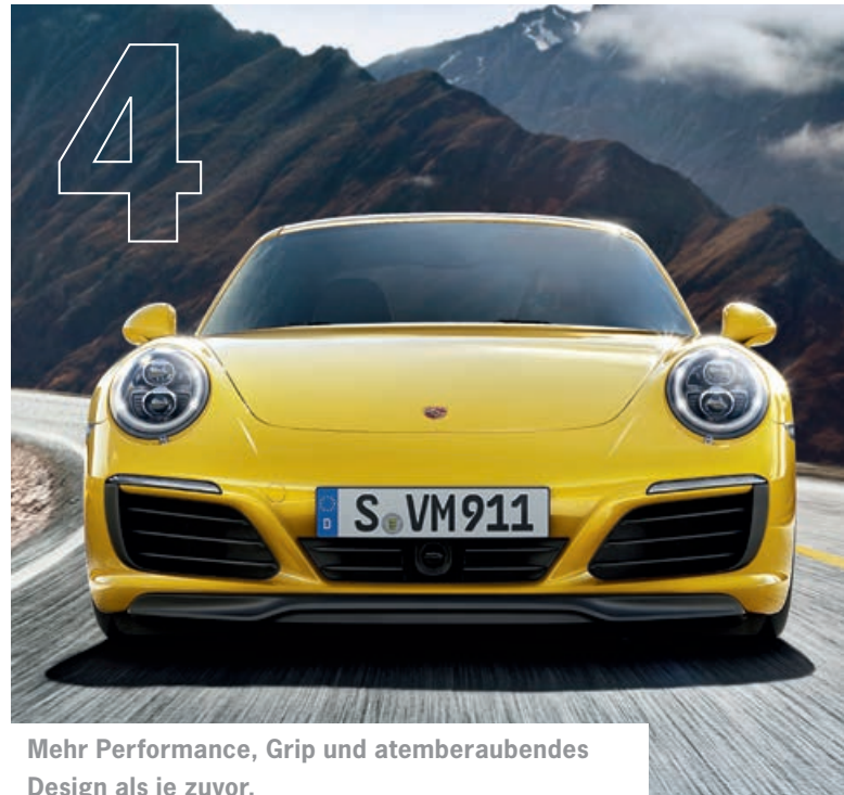
Mehr Performance, Grip und atemberaubendes Design als je zuvor.