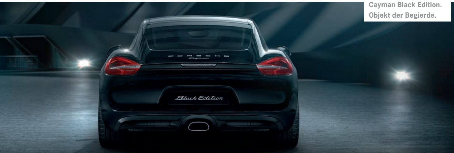
Cayman Black Edition. Objekt der Begierde.