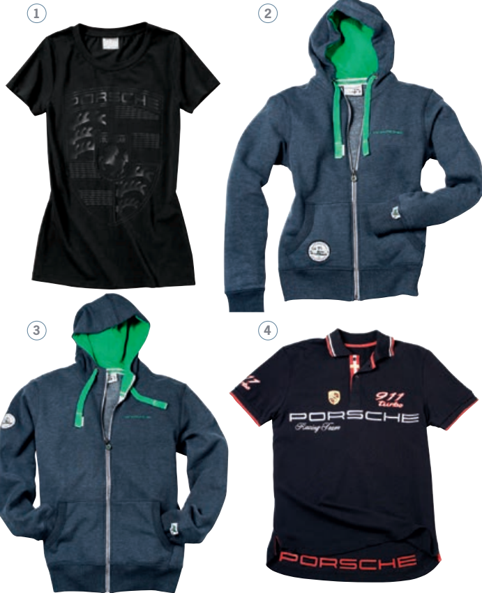
Wappen T-Shirt Damen schwarz, S-L WAP 797 XXX OE | EUR 45,-