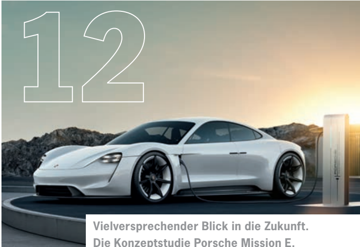
Vielversprechender Blick in die Zukunft. Die Konzeptstudie Porsche Mission E.