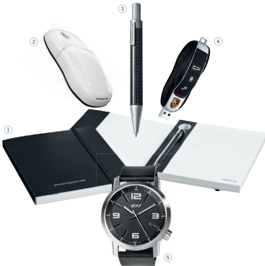
Notizbuch klassisch, schwarz WAP 092 005 OD | EUR 19,-