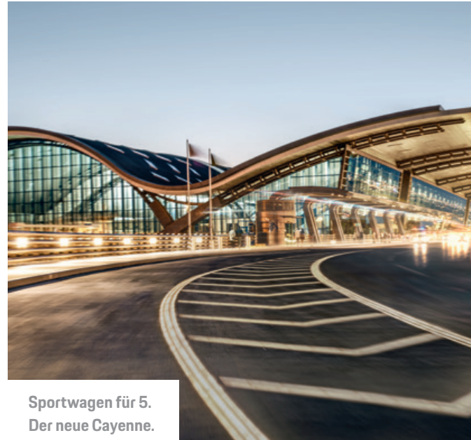
Sportwagen für 5. Der neue Cayenne.