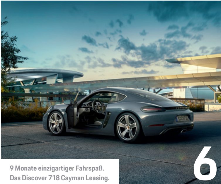
9 Monate einzigartiger Fahrspaß. Das Discover 718 Cayman Leasing.