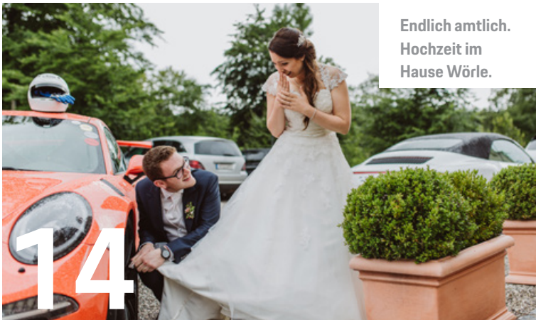
Endlich amtlich. Hochzeit im Hause Wörle.