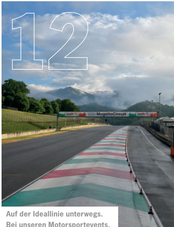
Auf der Ideallinie unterwegs. Bei unseren Motorsportevents.

Porsche 911 Turbo S Exclusive Series · Kraftstoffverbrauch (in l/100 km): innerorts 11,8 · außerorts 7,5 · kombiniert 9,1; CO 2 -Emissionen kombiniert 212 g/km Porsche 911 GT2 RS · Kraftstoffverbrauch (in l/100 km): innerorts 18,1 · außerorts 8,2 · kombiniert 11,8; CO 2 -Emissionen kombiniert 269 g/km