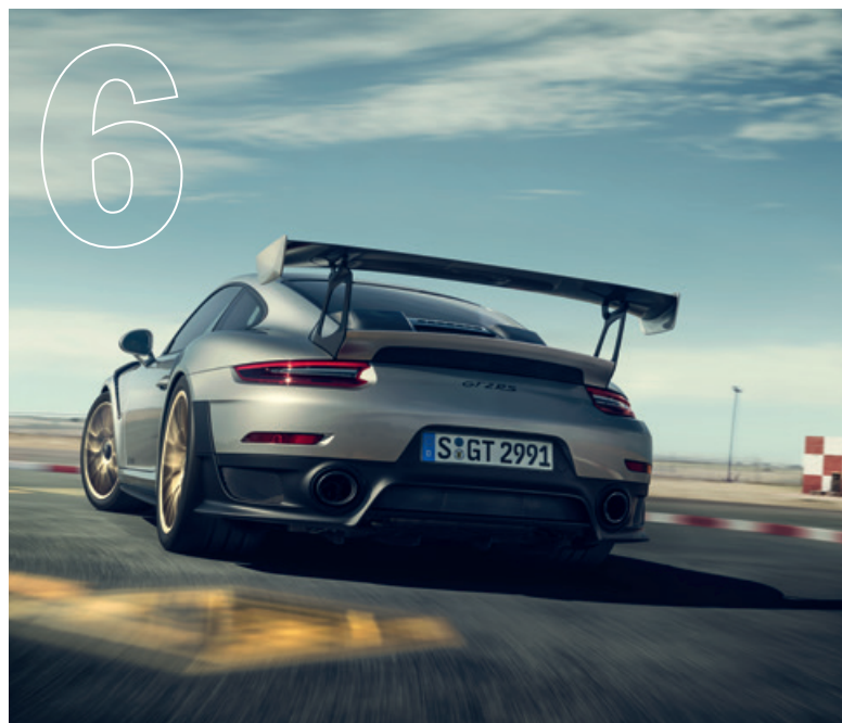
Lässt seinen Worten Taten folgen. Der neue 911 GT2 RS.