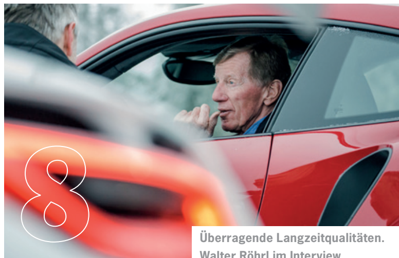
Überragende Langzeitqualitäten. Walter Röhrl im Interview.