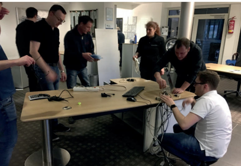
Vor dem Umbau

Porsche 911 Carrera GTS · Kraftstoffverbrauch (in l/100 km): innerorts 12,9–10,7 · außerorts 7,3–6,9 · kombiniert 9,4–8,3; CO 2 -Emissionen kombiniert 212–188 g/km