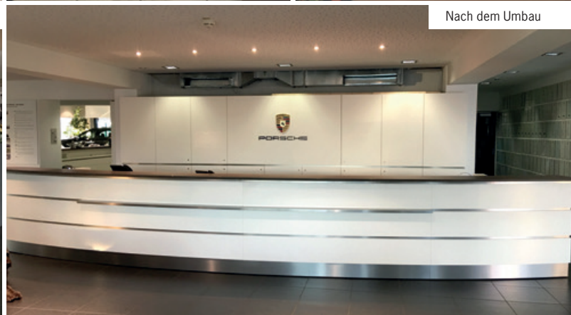
Nach dem Umbau