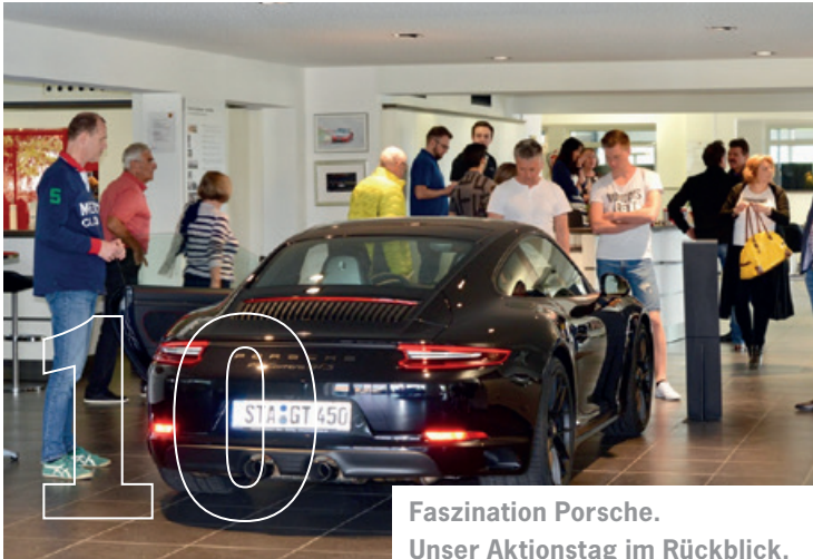
Faszination Porsche. Unser Aktionstag im Rückblick.