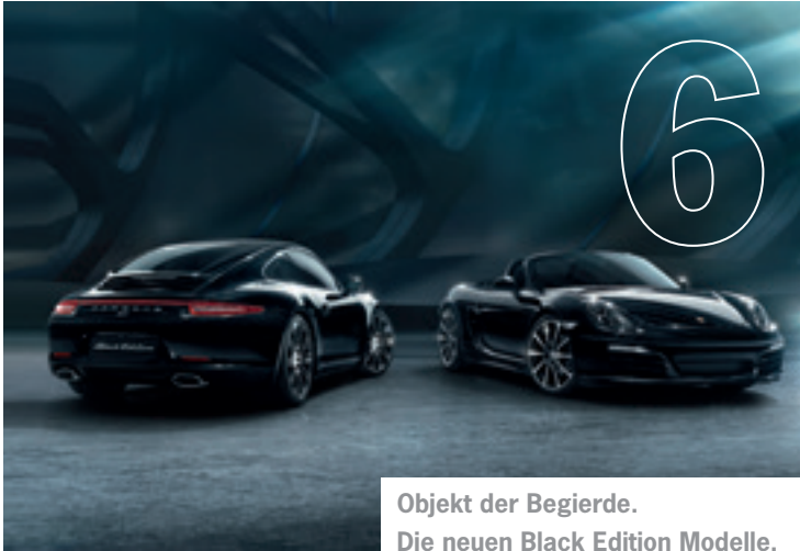
Objekt der Begierde. Die neuen Black Edition Modelle.