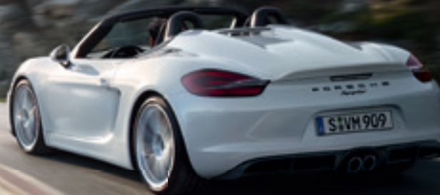
Ungefiltert. Der neue Boxster Spyder.