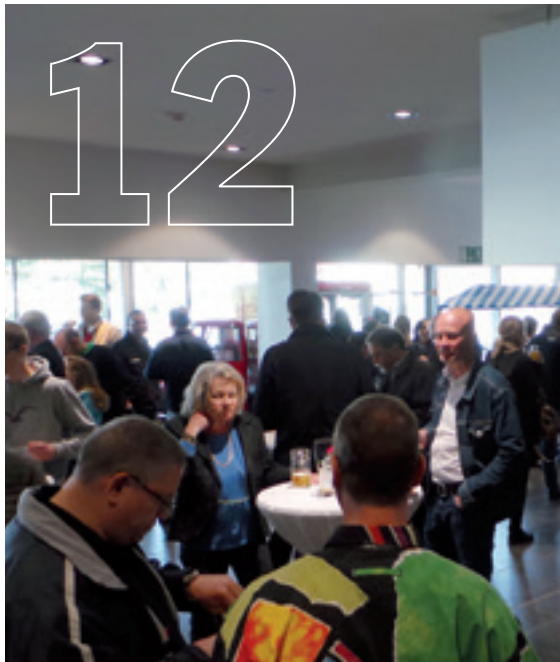
Zwei gute Gründe um zu feiern: Aktionstag „Faszination Porsche“ und Jubiläum.